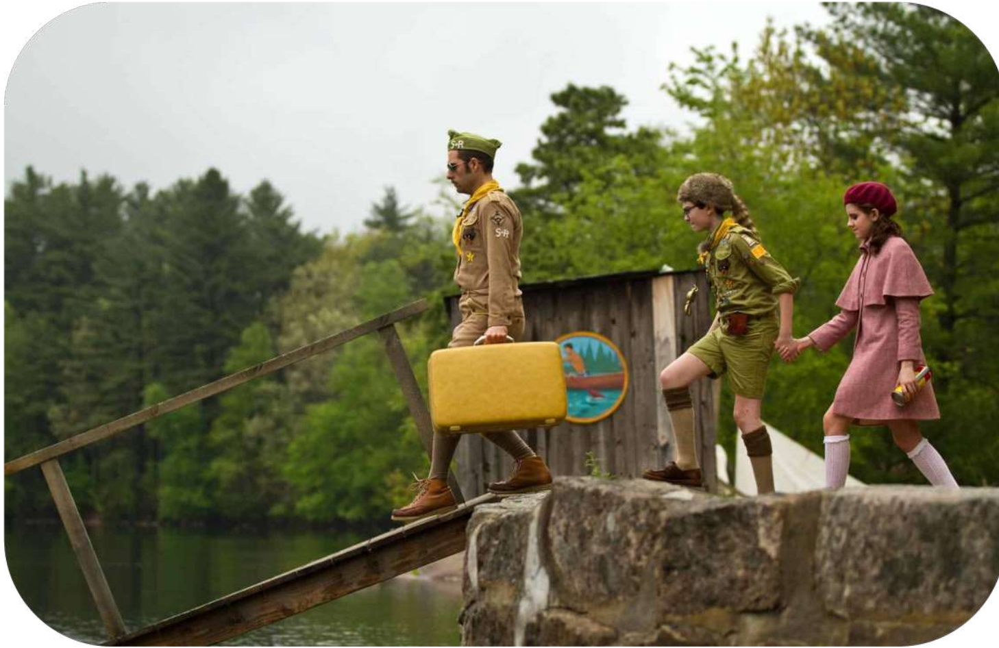
fotogramma da Moonrise kingdom - una fuga d'amore (2012)

Il FOCUS è sugli APPRENDIMENTI e le RELAZIONI , quindi è coinvolta in primo luogo la SCUOLA anche in collaborazione con il TERZO SETTORE